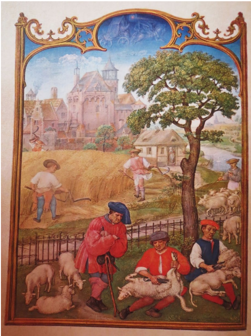
Monatsbild im Breviarium Grimani, Brügge, ca. 1515

2020 IVLIV s a IVLI o Caesare VoCat Vr q VI t Vn C eX host Ib Vs CL eopatra et Anton Io V beranter tr IVM pha VI t : habet fest IVI tates: Bona Vent Vrae, Hen RICI , IaCob I aposto LI , p I ae Annae genetr ICI s VI rg IN Is p V rae atq Ve Ignat II. – Der Juli hat seinen Namen von Julius Caesar, der damals über seine Feinde Kleopatra und Antonius herrlich triumphiert hat; er hat als Feste das des Bonaventura (14.), des Heinrich (15.), des Apostels Jakobus (25.), der hl. Anna, der frommen Mutter der reinen Jungfrau Maria (26.) und des Ignatius (31.). – vgl. Durandus, Rationale 8,4,9