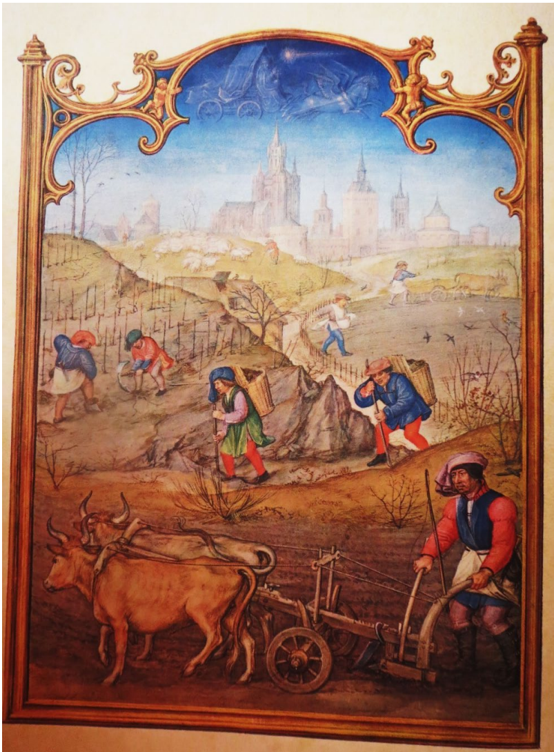
Monatsbild im Breviarium Grimani, Brügge, ca. 1515

Zum 1. März, dem Beginn des Monats März: