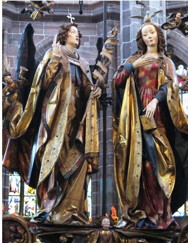
Veit Stoß: Engelsgruß (1518) – Nürnberg, Lorenzkirche

2020* a Ve , Ma r Ia , ser Va p Vr iss IMa , ora pro tot Is nob Is . - Gegrübet seist Du, Maria, reinste Magd, bitte für uns alle.